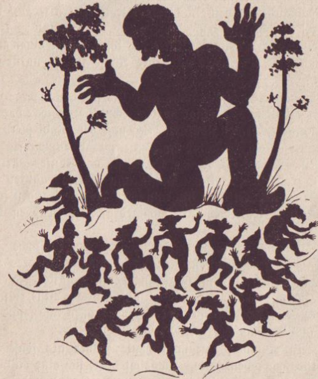
Es sah aus wie ein Ameisenhaufen, in den ein Töpel getreten ist.

Warum der Riese so laut lachte? Ei, er hatte die Köpfe der Zwerge vorhin beim Umwechselln nicht in ihre natürliche Lage gebracht, sondern jeden Kopf, den er aufsetzte, um eine