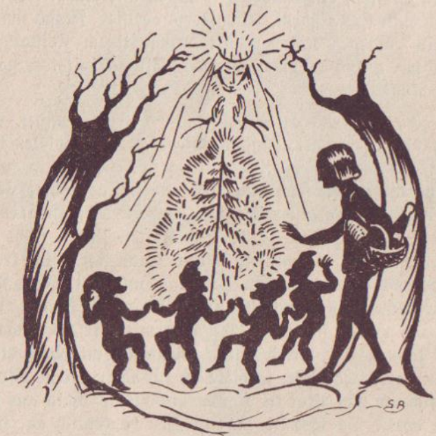
Und die Zwerglein tanzten um den glühenden Tannenbaum . . .

Als die Mutter durch den Kerzenschimmer erwachte,