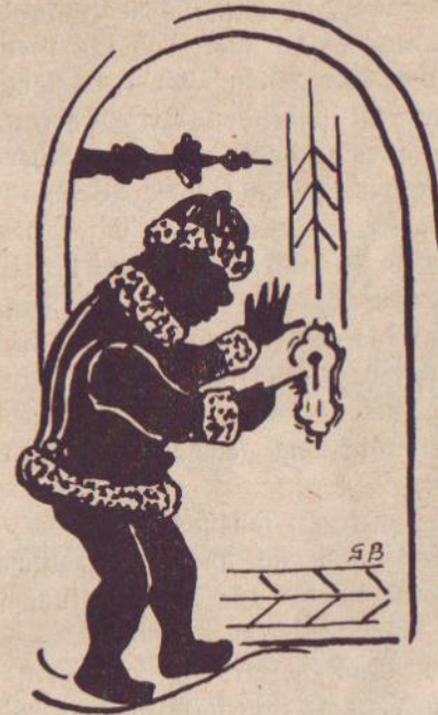
Frizchen trat an die niedrige Turmpforte heran, die fest verschlossen war . . .

Er schlich sich hinzu und öffnete sie vorsichtig. Da sah er sich in einem hellerleuchteten geräumigen Saale. Golddurchwirkte buntseidene Wandbehänge verliehen ihm das Aussehen eines festlichen Prunkgemaches. Auf hohen Pol-