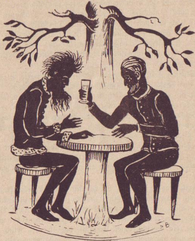
Der Blondbärtige stellte Fritz ein Glas Wein vor, das . . .

die beiden Männer lagen sich gerührt in den Armen und gaben sich ganz der Freude hin über das unverhoffte Wiedersehen nach jahrzehntelanger Trennung.