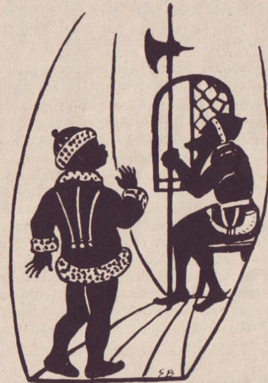
In der geräumigen Fenster- nische saß ein alter langbärtiger Turmwächter.

Als er aber die schwere Eichentüre öffnete, traute er kaum seinen Augen. Die Wände waren schön weiß ge-